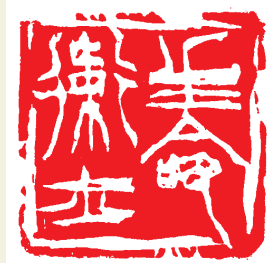
■ 生命卫士(篆刻) 陈永春