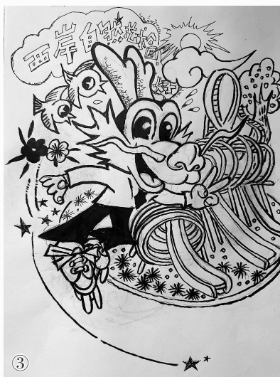
西岸自然艺术公园