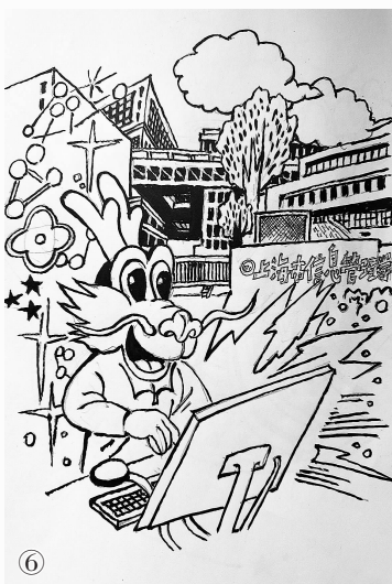
上海市信息管理学校