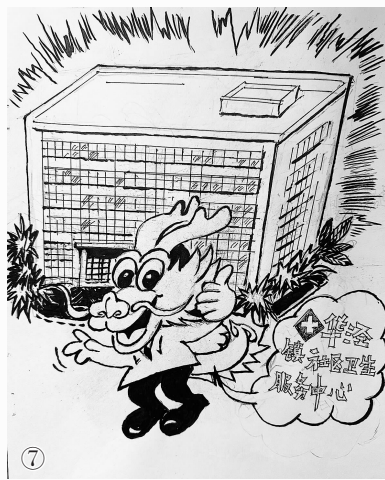
华泾镇社区卫生服务中心