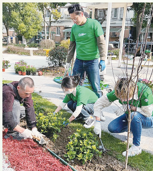
古三“友爱家园”志愿者队伍和星巴克伙伴携手共建社区花园