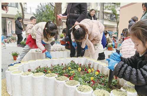
古一青少年成为花园首批“拓荒者”

古一“四叶园”前身为两楼间的荒废绿地,花园的设计者是周边楼栋的一位家长。出于“想给孩子们一片安全的活动空间”的愿望,他将“社区