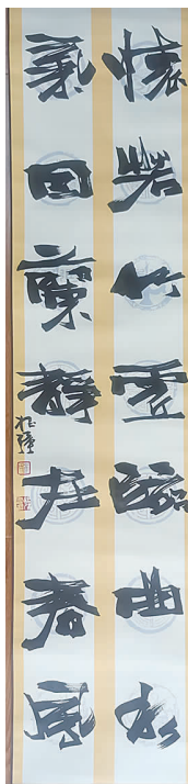
▲ 书法对联 《怀气因》