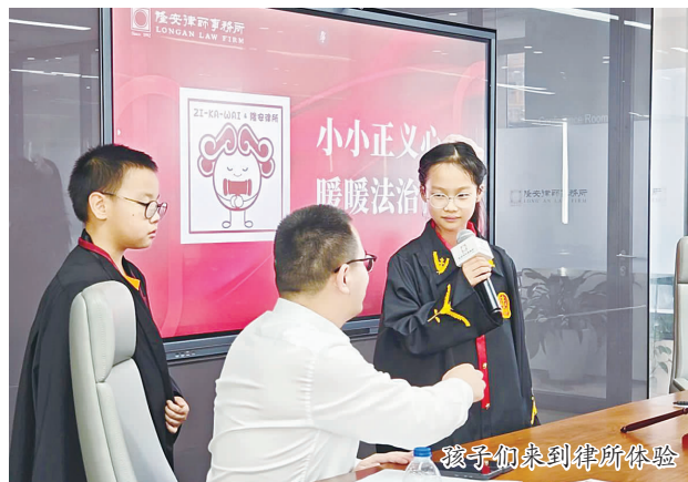
孩子们来到律所体验

紧张严肃的“模拟法庭”过后,孩子们带着好奇向律师提出了问题,律师们以专业的素养和丰富的经验,解答了孩子们的问题,同时分享了他们在职业生涯中的宝贵经验和对“法”的深刻见解。“从规则到正义”的沉浸式叙事,律师们为孩子们解码了法律与生活的紧密联系。